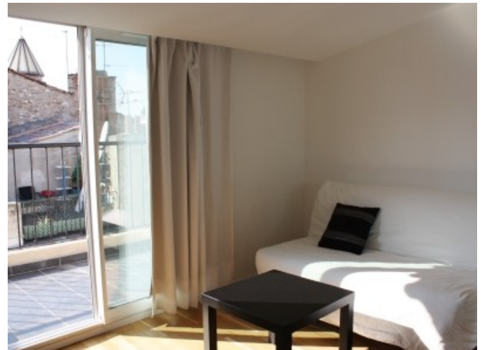
Photo de l'un des appartements avec terrasse

Pour plus de renseignements, Contactez nous au 04 91 900 100