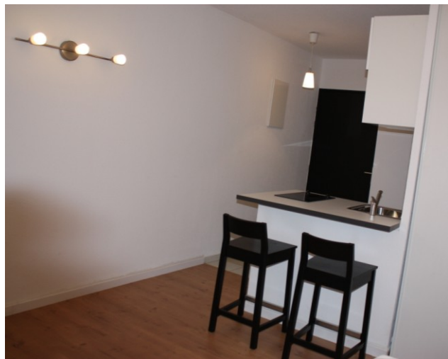
Photo de l'un des appartements

Pour plus de renseignements, Contactez nous au 04 91 900 100