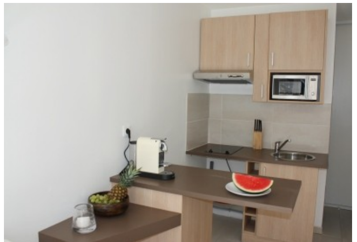
Exemple de finitions